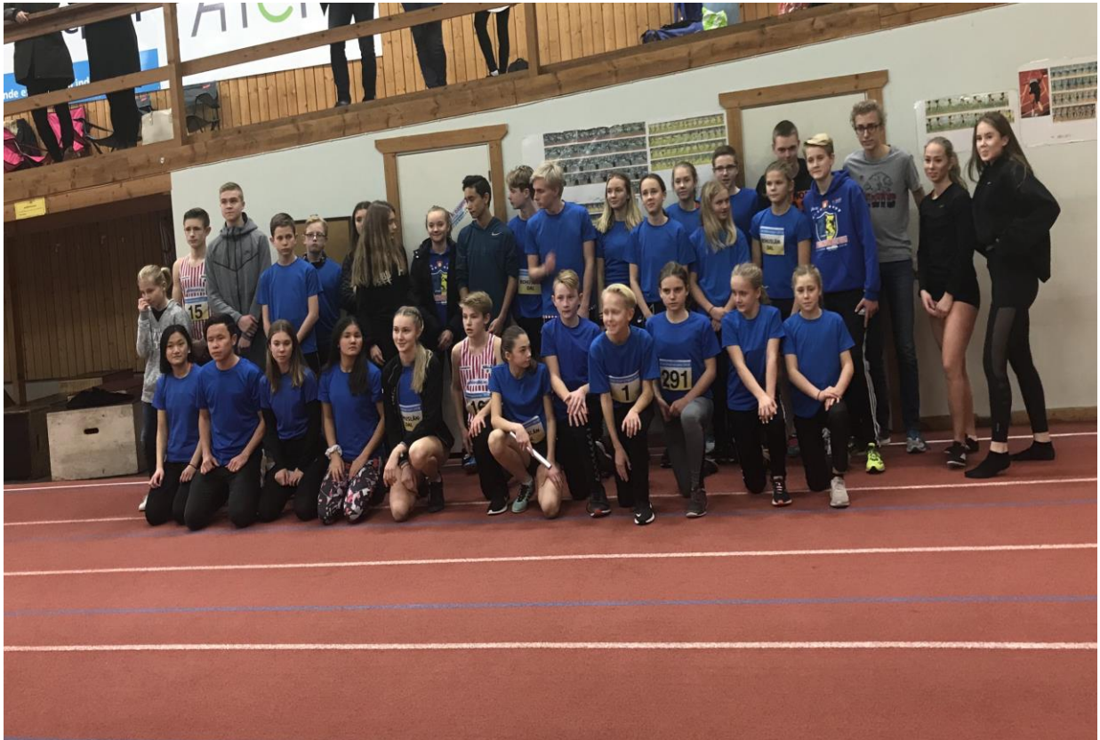
Distriktskampen i Karlstad den 16/12 2018. Där BDFIF tog en mycket fin andraplats, bland 6 lag.