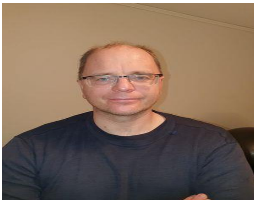
Johan Sjöholm Tyft Arena